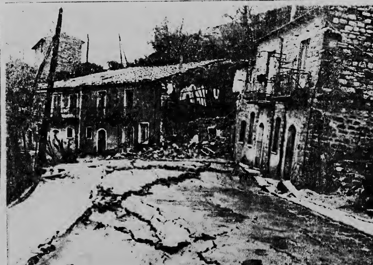
Un caya tur na skeur i casnan kibra. Es- aki ta un bista di e ciudad Capoles un bario mas o menos setenta kilometer for di Na- pels na Italia, caminda un awacera inter- minable a cai causando un movimiento di tera grandi. Danjo tabata enormemente grandi, hopi hende a keda sin dak, y pa completa e desgracia a cuminsa vries di nobo atrobe na e parti tormenta aki.

LONDEN, 4 maart. — Diamars a- wor e prome procesonan lo cuminsa na Bagdad contra oficialnan, cu a lanta na januari contra e revolucion na Irak, asina Radio Cairo a partici- pa. Un tribunal militar lo dirigi e procesonan.